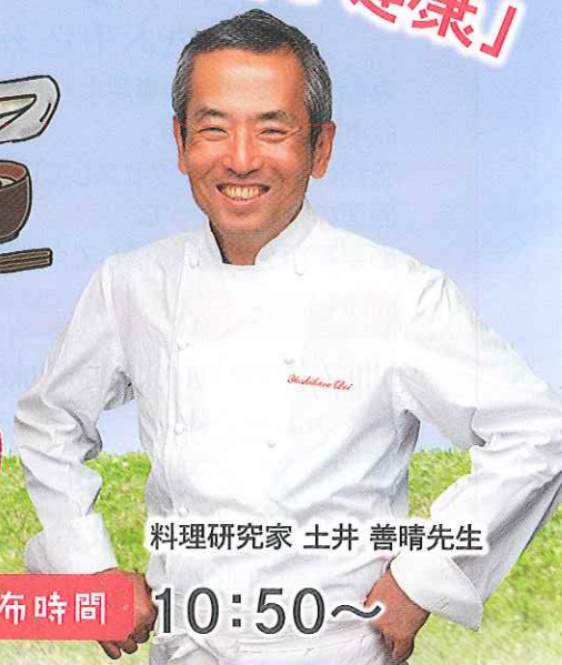
料理研究家 土井 善晴先生