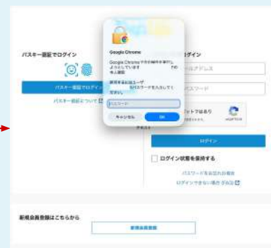
PIN・パスコードによる認証