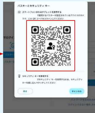
クロスデバイス認証 (QRコード)