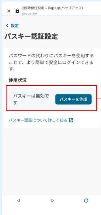
パスキー設定画面