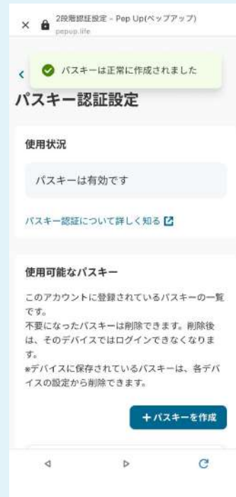
パスキー設定画面