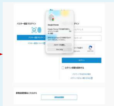
生体認証による認証