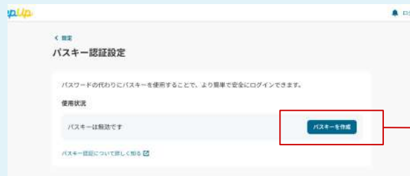
パスキー設定画面