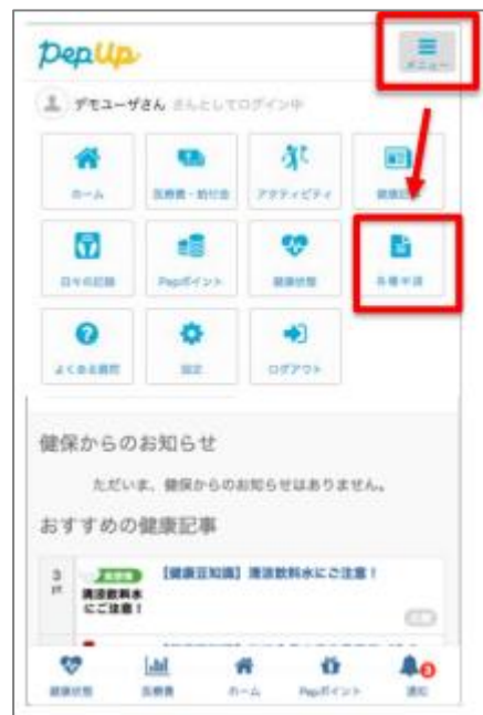
HOME画面(スマートフォン)