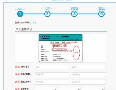
オンラインユーザー登録画面